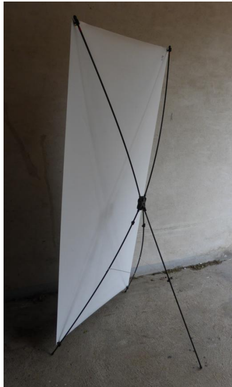
Panneau monté, vu de derrière