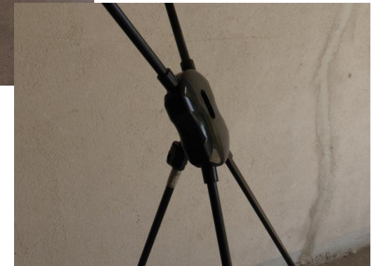
La noix d'assemblage avec mécanisme à cliquet