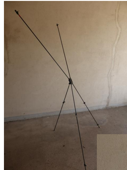
Structure montée, avec le bras arrière en retrait